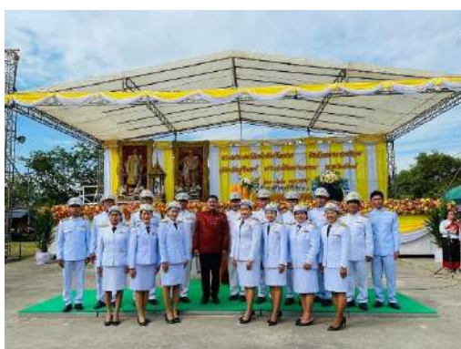
ร่วมงานประเพณีแข่งเรือ ชิงถ้วยพระราชทาน

ข้าพเจ้ามีความรับผิดชอบต่อตนเองและหน้าที่ที่ได้รับมอบหมาย โดยยึดหลักความรับผิดชอบต่อตรวจสอบได้ดังนี้ ความรับผิดชอบที่ตรวจสอบได้เป็นการสร้างกลไกให้ตนเองเป็นผู้รับผิดชอบ ตระหนักในหน้าที่ ความสำนึกในความรับผิดชอบต่อสังคม การเอาใจใส่ปัญหาสาธารณสุขของบ้านเมือง และกระตือรือร้นในการแก้ปัญหา ตลอดจนการเคารพในความคิดเห็นที่แตกต่างระหว่างบุคคล และความกล้าที่จะยอมรับผลจากการกระทำของตน