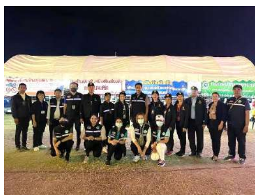
ปฏิบัติหน้าที่พนักงานเจ้าหน้าที่ฯ(พสน)