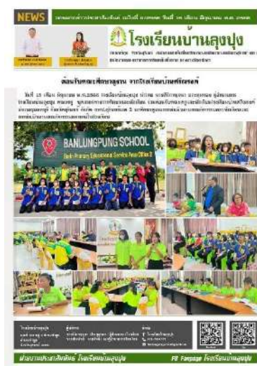
รับคณะศึกษาดูงานจากโรงเรียนบ้านศรีนครินทร์