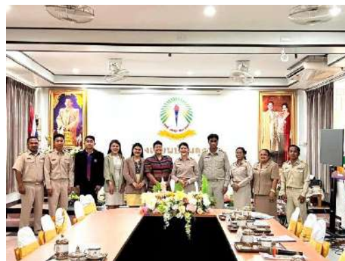
รับคณะนักศึกษาฝึกประสบการณ์วิชาชีพ ระดับปริญญาโทสาขาการบริหารการศึกษา มหาวิทยาลัยราชภัฏภาคย์