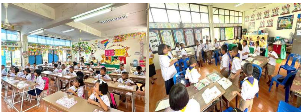
การสังเกตการณ์สอนและสะท้อนผลการสอนร่วมกับครูในกิจกรรมเปิดชั้นเรียน

ข้าพเจ้ายึดหลักการครองคน การร่วมทำงานเป็นทีม การจงใจให้เกิดการยอมรับแลเชื่อว่าการเป็นผู้บริหารที่ดี คือ “ผู้บริหารที่สามารถเข้าไปนั่งในใจคนได้” โดยให้ความช่วยเหลือดังนี้ ให้ความคิดเห็น คำปรึกษา และข้อเสนอแนะ ให้ความช่วยเหลือในเรื่องงานและเรื่องส่วนตัวต่อผู้ใต้บังคับบัญชา นักเรียน ผู้ปกครอง ชุมชน เพื่อนร่วมงานเปรียบเสมือนทุกคนเป็นญาติของข้าพเจ้า โดยดูแล ให้ความรักและเอาใจใส่ มีน้ำใจ เอื้อเฟื้อเกื้อกูล เป็นกัลยาณมิตรต่อทุกคน