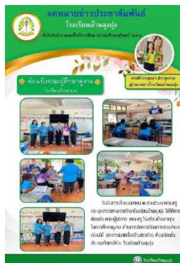
รับคณะศึกษาดูงานจากโรงเรียนบ้านอาคุณ