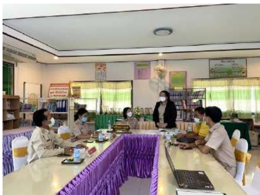
รับนักศึกษาฝึกวิชาชีพบริหารการศึกษา ระดับปริญญาโทสาขาการบริหารและพัฒนการศึกษา มหาวิทยาลัยสารคาม

ข้าพเจ้าปฏิบัติงานได้สำเร็จอย่างมีคุณภาพภายในเวลาที่กำหนดจนประสบผลสำเร็จ และมีผลงานเชิงประจักษ์เป็นที่ยอมรับ เป็นแบบอย่างที่ดีด้านการบริหารจัดการศึกษา ส่งผลให้โรงเรียนบ้านลุงปุง เป็นสถานที่ฝึกประสบการณ์วิชาชีพ ระดับปริญญาโท สาขาการบริหารการศึกษา และเป็นสถานที่ศึกษาดูงาน